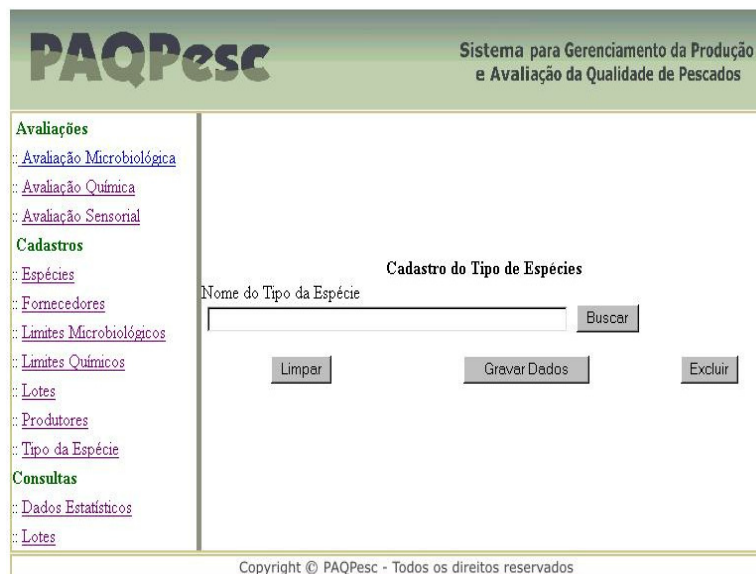
Figura 3. Cadastro de Tipo de Espécies.