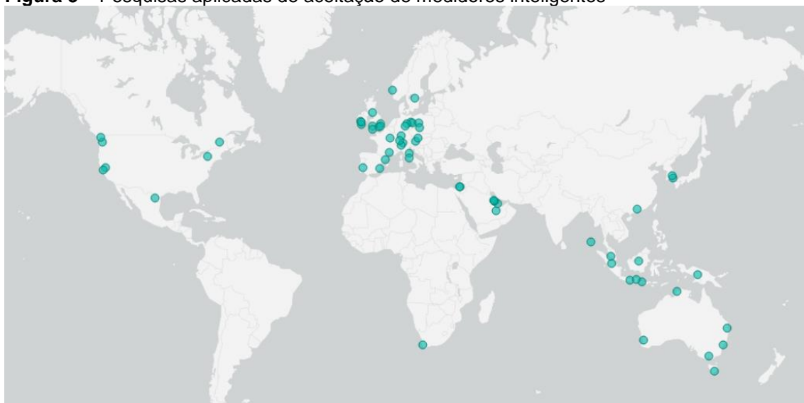
Figura 3 – Pesquisas aplicadas de aceitação de medidores inteligentes

na Europa, Estados Unidos, Austrália e sudeste Asiático. A Europa apresenta uma maior concentração de estudos em razão da diretriz para implementação de medidores inteligentes em 70% das residências dos países do bloco europeu (EUROPEAN UNION, 2009). Na Austrália se concentram os estudos para a implementação de medidores inteligentes para o controle do consumo de água (e.g., BEAL; FLYNN, 2015). A compreensão dos fatores importantes para a aceitação de medidores inteligentes em países em desenvolvimento ainda é pouco explorada, com exceção de estudos realizados na África do Sul (BOOYSEN; VISSER; BURGER, 2019) e Indonésia (CHOU; YUTAMI, 2014).