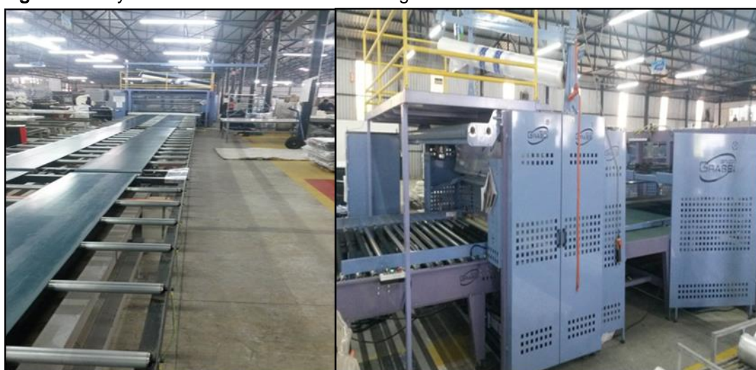
Figura 2 – Layout do setor de revisão e embalagem

Com a ampliação da área construída do complexo industrial motivou-se a alteração de layout das atividades N-O para contribuir com a melhoria contínua do processo. A esteira que leva os colchões foi alocada ao sentido da máquina, ficando interligada com sistema de sensores automáticos, o que possibilitou ao setor retirar as 2 mesas de revisão e a máquina seladora por temperatura, pois a os elementos da atividade que compõem revisar o produto, são agora realizados na própria esteira. O fluxo do processo ganhou com isso, pois não há mais interrupções manuais em retirar os produtos da esteira, pois eles estão agora, alinhados e seguindo para a embalagem de maneira seqüencial. Outro efeito favorável é de que foi possível reduzir o efetivo de funcionários de cinco para três. A Figura 2 apresenta o layout com a esteira e a máquina após a etapa 4.