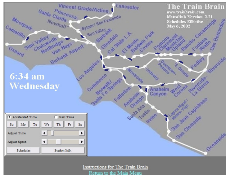
Figura 2. Metrolink