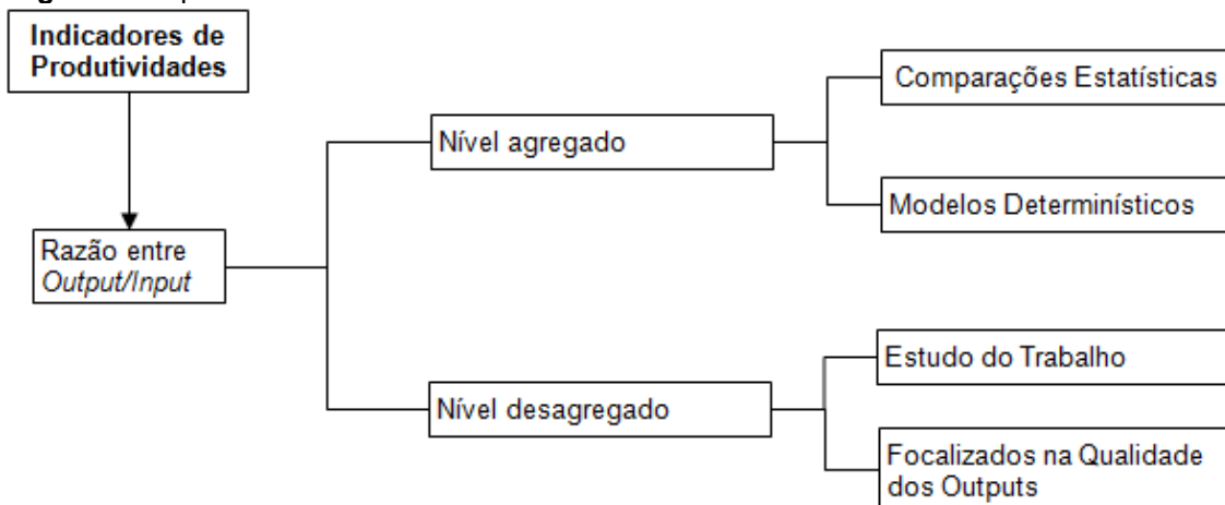
Figura 3 – Tipos de Indicadores de Produtividade